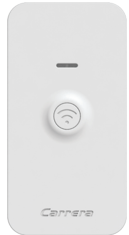
Thermostat connecté Home-SmartLink réf. FP11